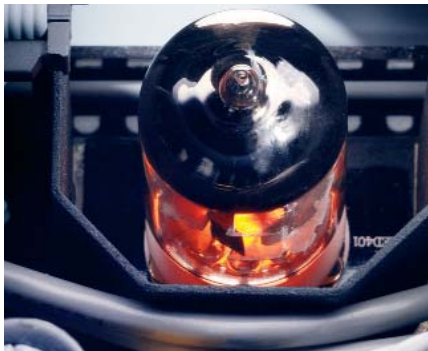
Eine selektierte und "eingebraunte" Doppeltrioden-Röhre vom Typ ECC 88