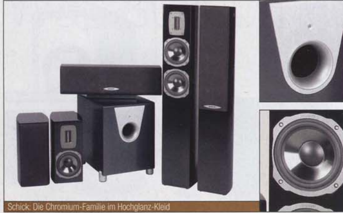
Schick: Die Chromium-Familie im Hochglanz-Kleid

In diesem Set setzt Quadral auf präzise aufspielende Bändchen-Hochtöner, die eine fast massefreie Umwandlung elektrischer Impulse trotz größerer Membranfläche erlauben.