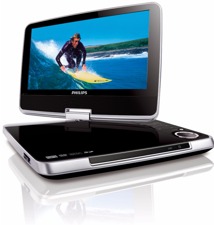
Philips Tragbarer DVD-Player