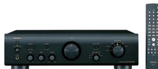
*Auch in Schwarz lieferbar.