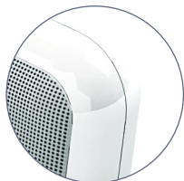
Finition : blanc ultra-brillant