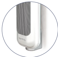
Supports muraux fournis