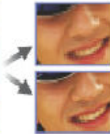
Video mit 3D-motion Adaptive De-interlace