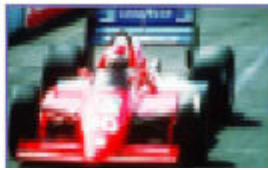
Video ohne Progressive Scan