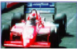
Video mit Progressive Scan